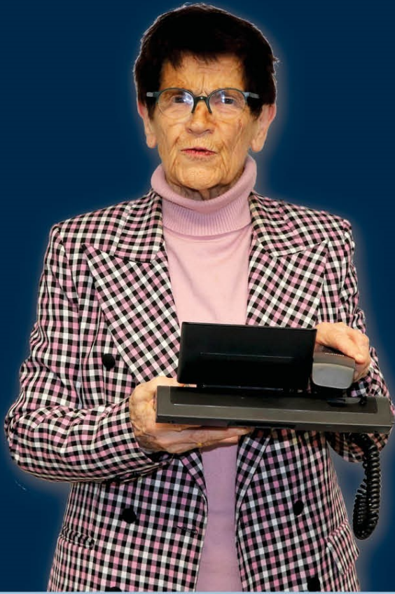
Rita Süßmuth Bundestagspräsidentin a.D.