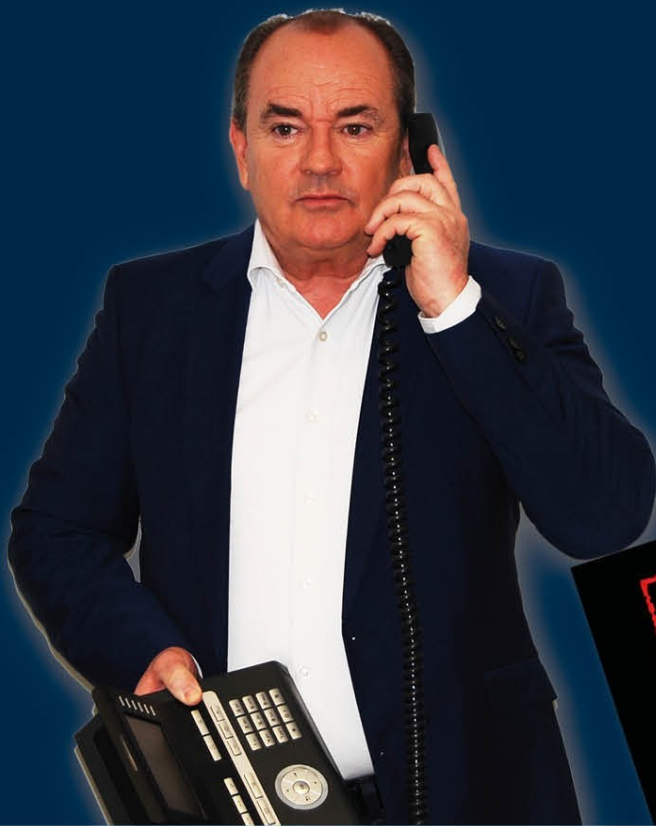
Wolfram Kons TV-Moderator