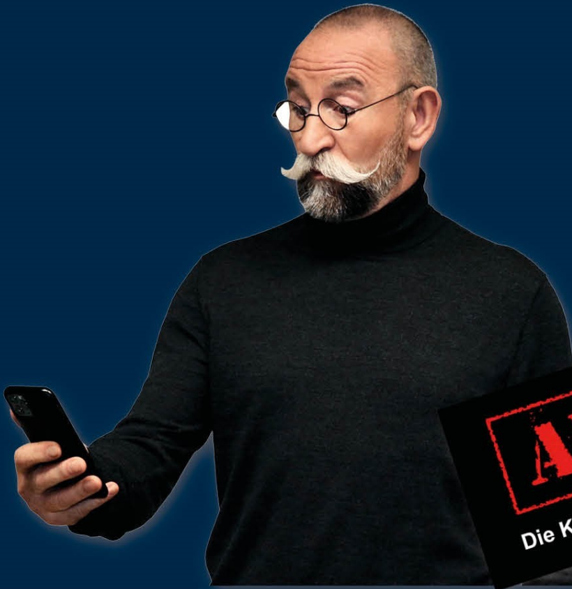
Horst Lichter TV Moderator